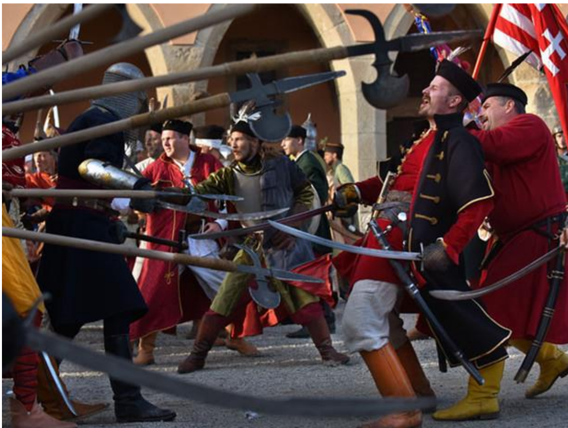
Ostromjáték Egerben